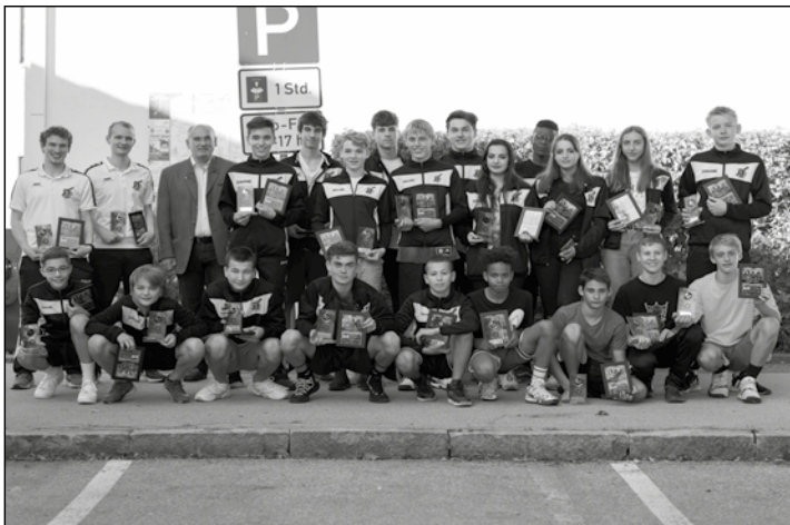
Basketball ist beim WSV immer mehr im Kommen.

Das Glonner Hallenbad freut sich auf Ihren Besuch! www.hallenbad-glonn.de