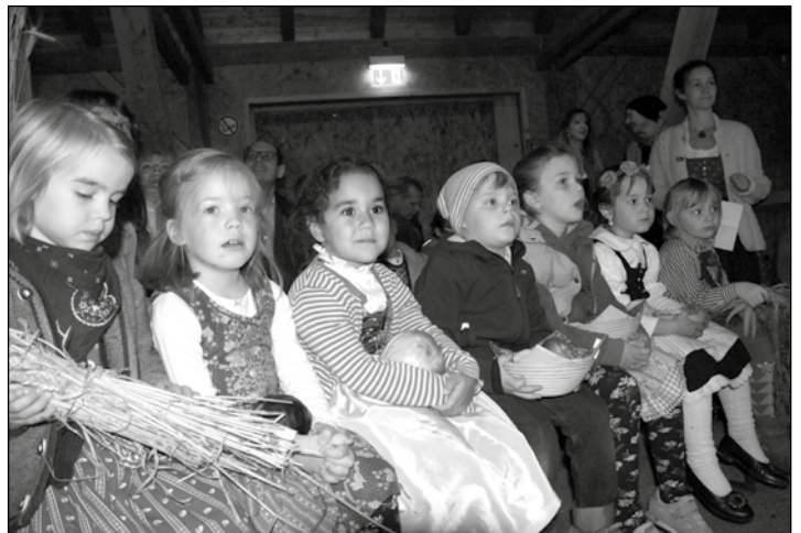
Nach dem Gottesdienst gings dann schnell raus zum Spielen.