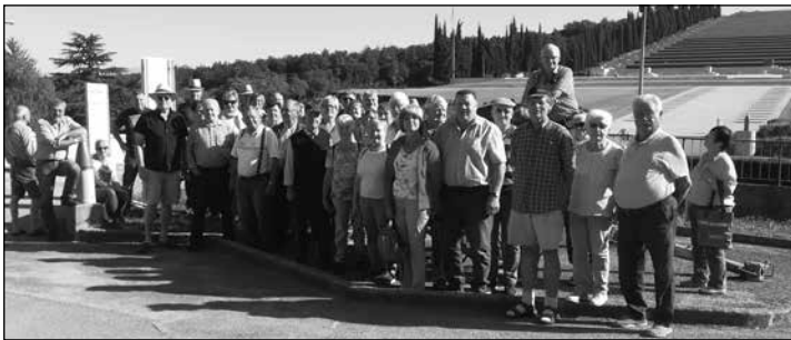
Bis auf den letzten Platz ausgebucht war die Fahrt des SKV.