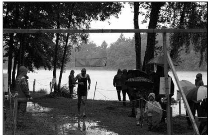
„Nur die Harten kommen in den Garten“, so könnte das Motto des diesjährigen Zehnteltriathlons der Wasserwacht gelautet haben.