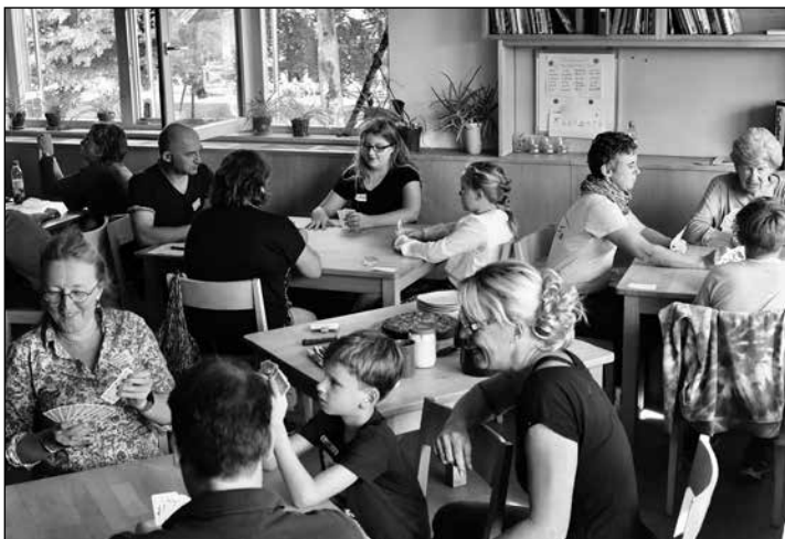
Schafkopfkurs 2019: Eine Bildungsinitiative des KiJuFa.