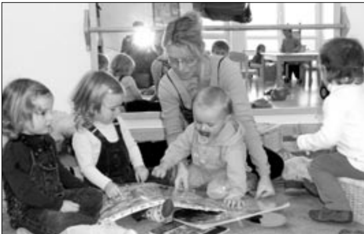
Eine professionelle und liebevolle Betreuung bietet die Kinderkrippe Zinneberg den Kleinsten.

Sommer ist keine Jahreszeit. Sommer ist ein Gefühl.