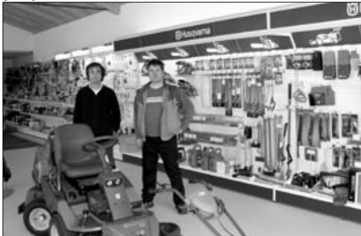
Vom Landwirt bis zum Hobbygartler, in der neugestalteten Landtechnikabteilung des Autohauses Steinbeißer wird jeder gut beraten.