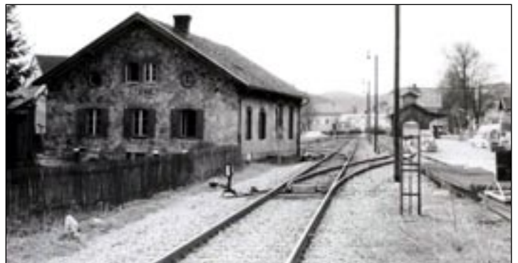
An diesen beiden Bildern kann man den Wandel Glonns sehr schön erkennen: Links vom altem Bahnhofsgelände war der Lagerplatz einer Baufirma und ein Acker ...