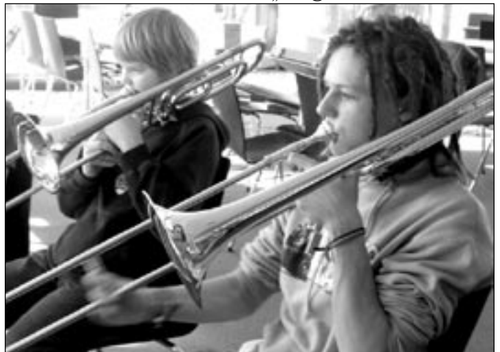
Musik fördert das Selbstbewusstsein von Kindern und Jugendlichen.

Anmeldung am 14.Mai von 15-16 Uhr im Rathaus oder bei der Musikschule in Grafing unter der Telefonnummer 08092/8195-20 oder „ info@musikschule-vhs.de “