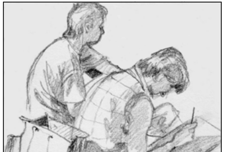
Es wird mit weichem Graphit gezeichnet oder mit hartem Tintenroller, mit Tusche und Pinsel oder mit der Schere gestaltet.

Die Ausstellung in der Galerie Klosterschule ist am Samstag, den 23.2. von 14 bis 18 Uhr und am Sonntag, den 24.2. von