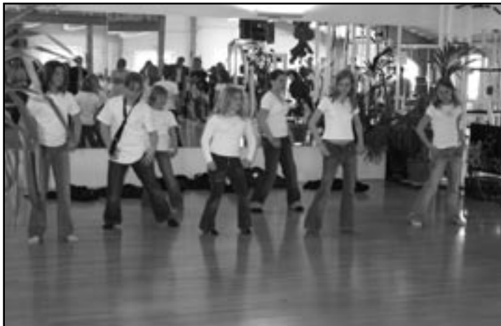
Außer der Tanzveranstaltung der Teenies gibts am Tag der „Offenen Türen“ jede Menge Infos rund um den Sport.

Nähere Informationen erhalten Sie tel. unter 08093 2222, 0172 63 288 28 (werktags ab 18 Uhr) oder per e-mail wsv@wsvglonn.de . Besuchen Sie uns doch unter www.wsvglonn.de . Christine Fritsch, WSV