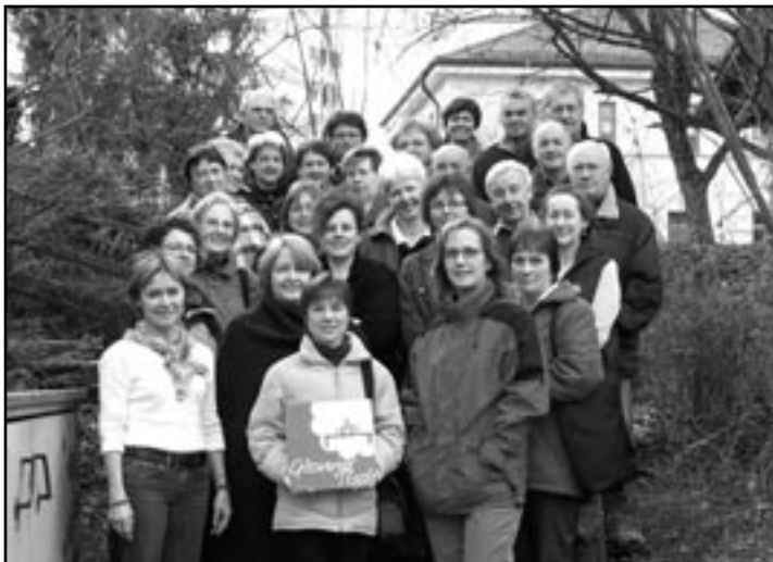
Das Team vom Glonner Tisch.