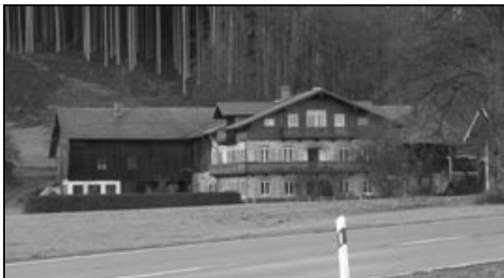
Der „Weighof“ in Ursprung.