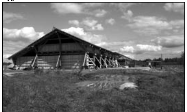
Die landwirtschaftlichen Gebäude werden in traditioneller russischer Holzbauweise erstellt.

Derweil leben über 600 Schweine, 100 Rinder sowie viele Pferde und Gänse auf dem 859 Hektar großen Hof, der rund 40 Familien Platz bietet. Schweisfurth hofft, dass es mit der Vermarktung der Lebensmittel klappt und die bäuerliche Landwirtschaft durch Projekte wie „Tolstoi“ wiederbelebt wird.